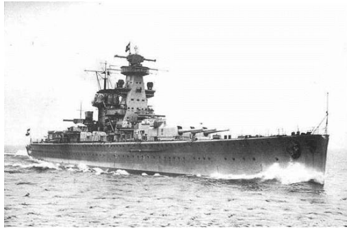
Тяжелый крейсер «Адмирал Шеер»

Но, что самое удивительное бронированный рейдер одновременно с «Дежневым» также вышел из боя. В 01:45 Меендсен-Болькен приказал лечь на обратный курс, в 01:46 «Адмирал Шеер» прекратил огонь и спустя четыре минуты скрылся за полуостровом Накваляня. За время этого эпизода боя крейсер израсходовал 25 280-мм, 21 150-мм и 32 105-мм снаряда.