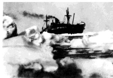
«Челюскин» в Чукотском море.

Опытный полярный капитан, глубоко веривший в ледовую трассу, обратился к начальнику Главсевморпути О. Ю. Шмидту с конкретным планом сделать рейс в одну навигацию в оба конца. Пройти из Белого моря в Берингов пролив и обратно, на сильном ледоколе это возможно».