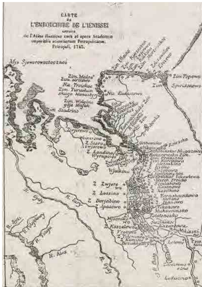
Карта устья Енисея отъ Азия Восточна, изданная нашею Императорскою Академію Науки въ 1746 году

моряков, действовавших в том крае... вме- сто того, чтобы изнуриться четырехлетним пребыванием на глубоком Севере, как из- нурялись все другие, он в 1742 году озна- меновал полноту своих деятельных сил